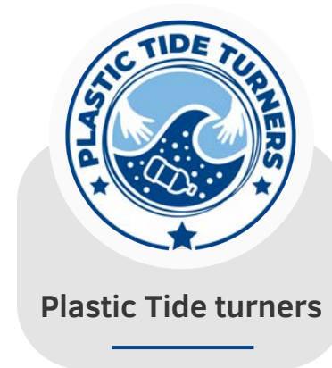
Plastic Tide turners