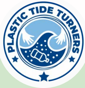
Plastic Tide turners