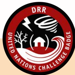
Fiatrehana loza voajanahary