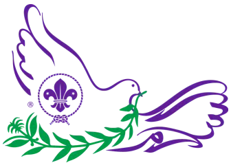
Messengers of Peace